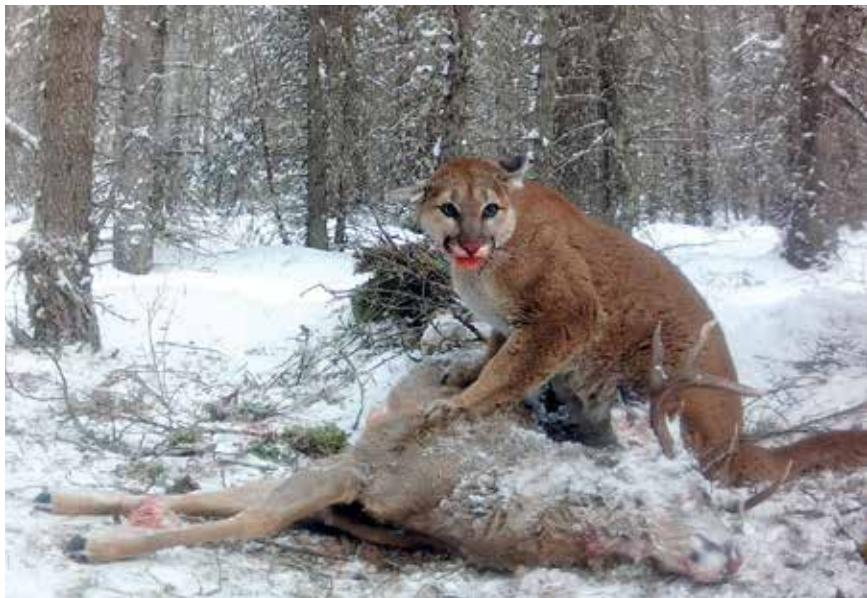
Le puma, félin énigmatique, qu'a pisté pendant trois hivers Neil Villard.

Le quatrième livre de Neil Villard est consacré à ce félin qui hante les montagnes Rocheuses. Le photographe animalier du Pâquier ne réalise pas seulement des clichés authentiques, il est aussi un narrateur hors pair pour magnifier la nature.