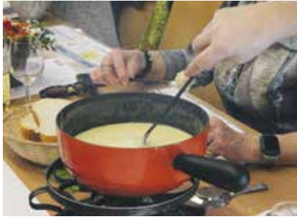
Partager une «gommeuse» aux 12 heures du fromage est devenu incontournable.