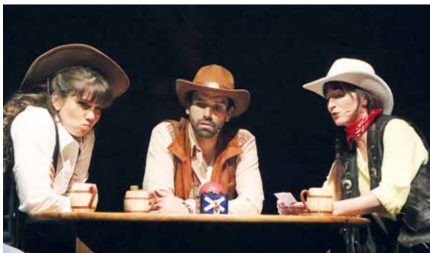
Ambiance Far West cette année à La Décharge (photo pif).

La revue satirique neuchâteloise a livré sa recette habituelle de fin d'année mélangée de sketches, de danses, de chants pour parodier l'actualité de l'année écoulée. Elle se produit jusqu'au 17 janvier à la Grange aux concerts de Cernier.